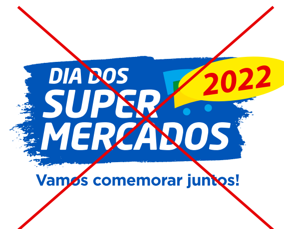
invadir a área de segurança