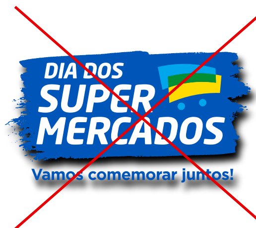
aplicar efeitos (sombras, volumes, brilhos, etc)