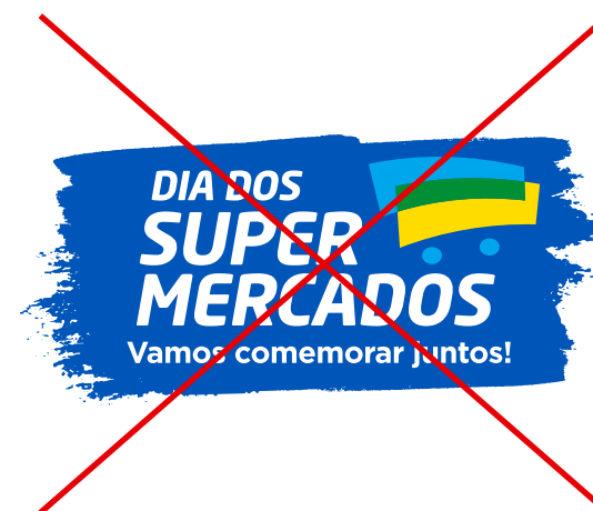
modificar a proporção ou posição dos elementos