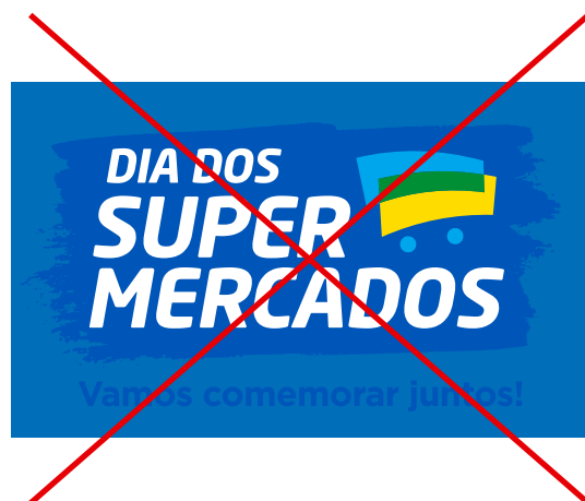
sem contraste com o fundo